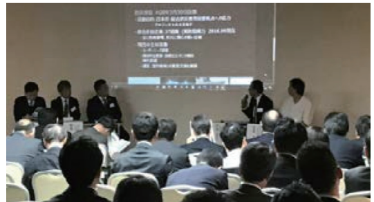
定例会でのパネルディスカッション(福島市内)