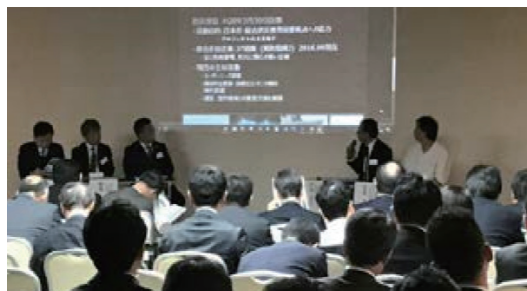
定例会でのパネルディスカッション(福島市内)